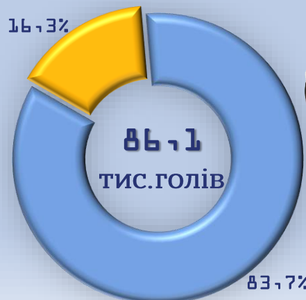
Поголів'я корів на 1 січня 2022 року (у % до загального обсягу)

90% молока у світі коров'яче, проте вже давно доведено, що козяче молоко значно корисніше і швидше засвоюється. Коров'яче молоко перетравлюється близько години, в той час як козяче за 20 хвилин. Середня жирність коров'ячого молока становить 3,7 грама жиру на 100 грамів молока (3,7%), а козячого близько 4,5%.