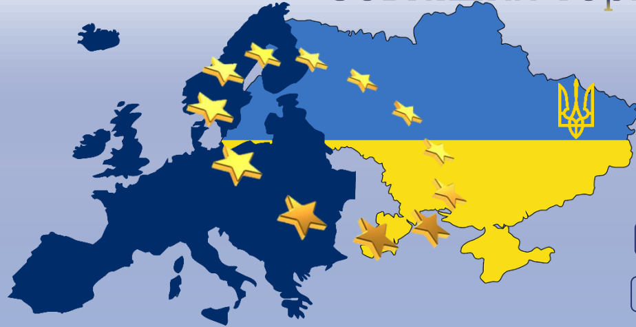
Географічна структура зовнішньої торгівлі товарами у 2021 році