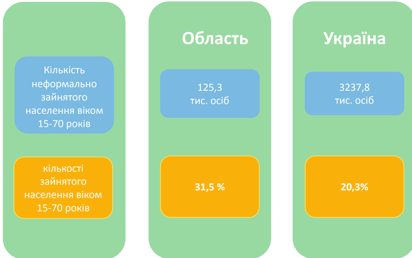
Неформально зайняте населення області у віці 15–70 років

Кількість неформально зайнятого населення віком 15–70 років по області у 2020р. становила 125,3 тис. осіб, що на 0,6 % менше, ніж у попередньому році. Їх частка у загальній кількості зайнятого населення відповідного віку в 2020р. складала 31,5 % (по Україні – 20,3%), що на 1,3 в.п. менше, ніж у 2019р.